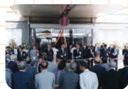
町創立四十周年記念式典挙行