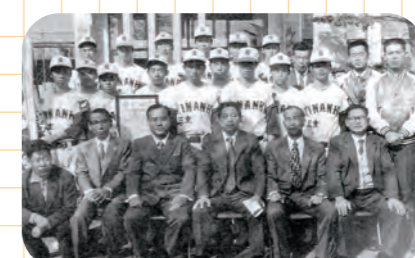
紀南高校ソフトボール部全国制覇、優勝報告に来庁