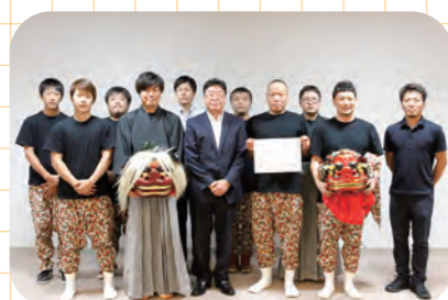
阿田和の獅子舞が無形民俗文化財に指定