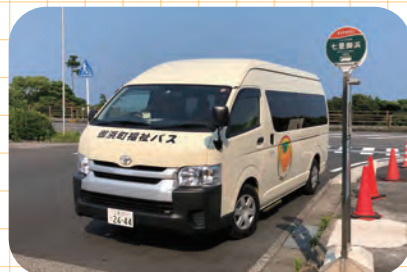
御浜町福祉バス運行開始