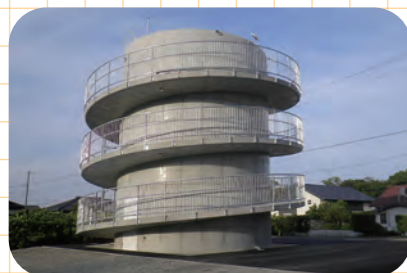
萩内・はまゆう台地区 津波避難タワー