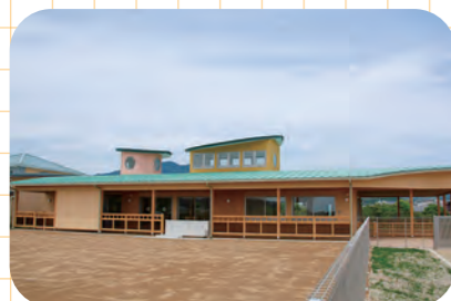
志原保育所子育て支援室の増築