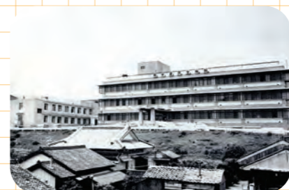
昭和43年頃 南牟婁民生病院(現紀南病院)