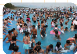
七里御浜大海水プール