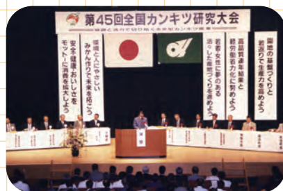
全国カンキツ研究大会