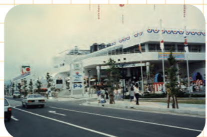
パーク七里御浜モール「ピネ」オープン