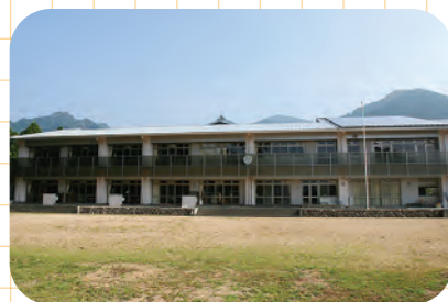
尾呂志学園新築完成