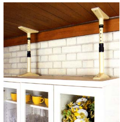
つっぱり棒タイプ