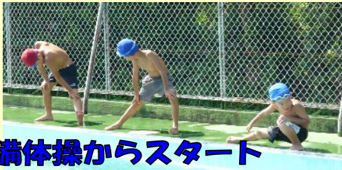
準備体操からスタート